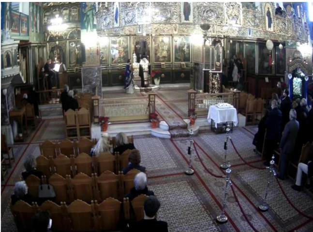
Ιερός Ναός Φανερωμένης Αιγίου, 09.01.2022

Επικαλούμαι εφ' Υμάς την Μεσιτείαν και την Χάριν της Υπεραγίας Θεοτόκου, της Τρυπητής, Πολιούχου του Αιγίου, και εύχομαι ταχεία επαναφοράν τόσον των ιερών Ναών μας, όσον και των ευσεβών χριστιανών, εις το αρχαίον κάλλος, προς Υμάς δε ΚΑΛΗΝ ΜΕΤΑΝΟΙΑΝ και ΚΑΛΟΝ ΠΑΡΑΔΕΙΣΟΝ!