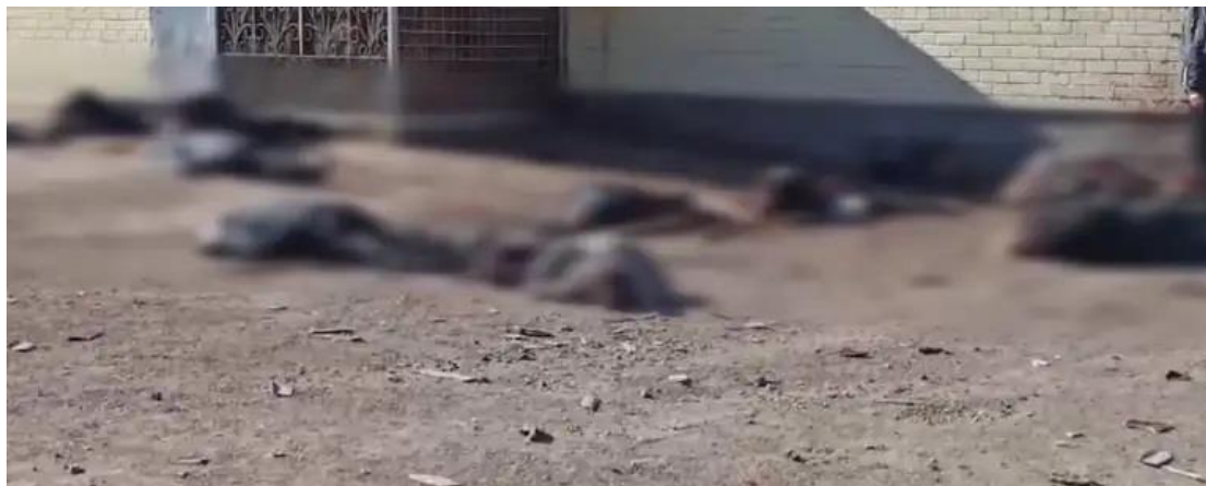
Ο ρωσικός στρατός άνοιξε πυρ εναντίον πολιτών που έκαναν ουρά για ψωμί στο Τσερχίνιβ (16 Μαρτίου 2022)

Από εδώ και πέρα ο «πατριάρχης Κύριλλος» και το πατριαρχείο Μόσχας πρέπει να εκλαμβάνεται και να αντιμετωπίζεται όχι ως θρησκευτικός λειτουργός αλλά ως αυτό που είναι, δηλαδή πολιτικό όργανο της Ρωσικής Ομοσπονδίας υπό το πρόσχημα της ορθόδοξης ιεραρχίας.