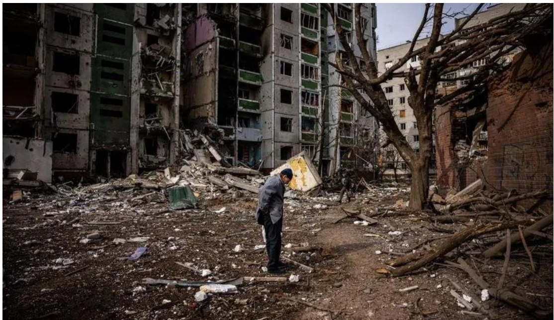
Ο απόηχος μιας ρωσικής αεροπορικής επιδρομής σε κατοικημένες γειτονιές στο Τσερνίχιβ που σκότωσε 47 πολίτες (3 Μαρτίου 2022)