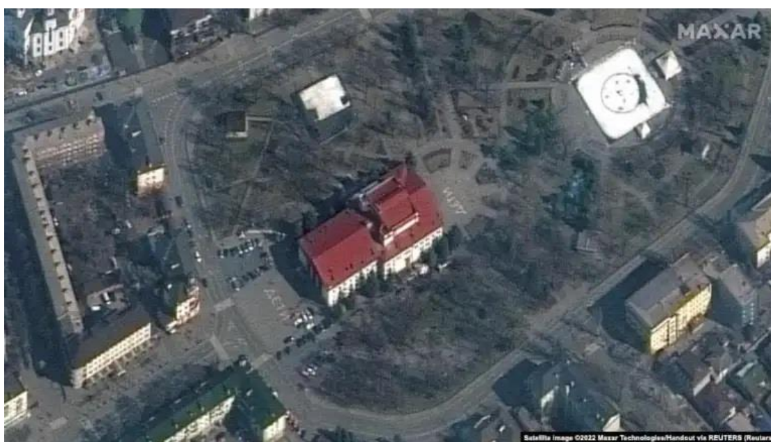
Το Δραματικό Θέατρο της Μαριούπολης που προστάτευε γυναίκες και παιδιά που κρύβονταν από τους βομβαρδισμούς. Η επιγραφή «Παιδιά» φαίνεται καθαρά από ψηλά, επομένως ο ρωσικός βομβαρδισμός της τοποθεσίας στις 16 Μαρτίου δύσκολα μπορεί να ονομαστεί «λάθος»