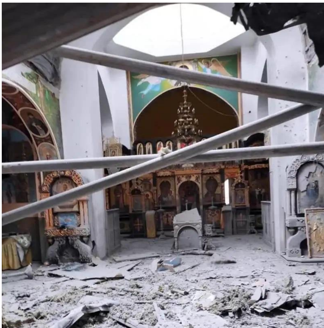
Στις 5 Μαρτίου, ως αποτέλεσμα του ρωσικού βομβαρδισμού, ο Ναός της Ανάληψης του Κυρίου υπέστη ζημιές στο χωριό Bobryk, στην περιοχή του Κιέβου