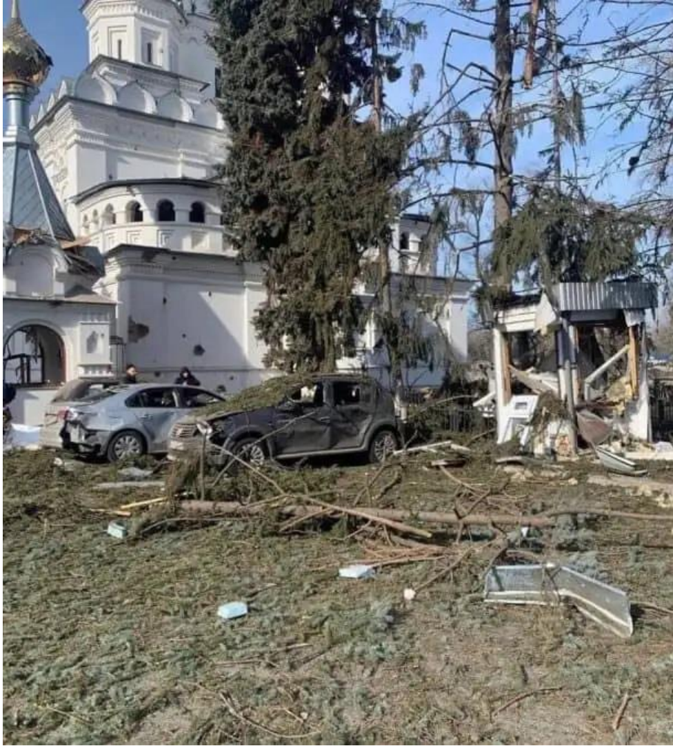
Η Εκκλησία της Αγίας Βασιλίσσας Ταμάρα στο χωριό Ryatyhatky, στην περιοχή του Χάρκοβο, μετά από ρωσικό βομβαρδισμό στις 12 Μαρτίου 2022