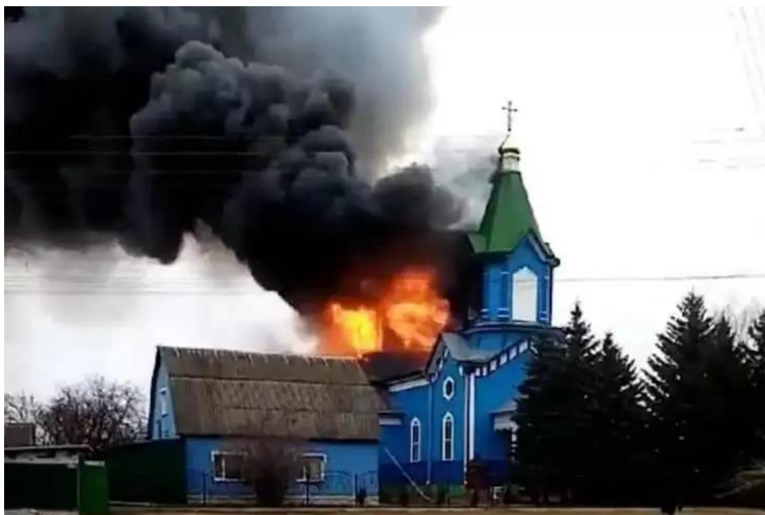
Στις 7 Μαρτίου 2022, οι ρωσικές δυνάμεις βομβάρδισαν μια εκκλησία του Αγίου Γεωργίου της εν Ουκρανία Ρωσικής Εκκλησίας στο χωριό Zanorychi, στην περιοχή Μπρόβαρι, στην περιοχή του Κιέβου