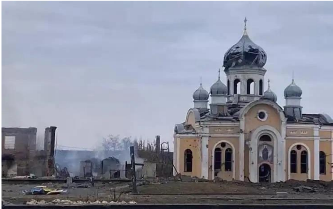
Στις 6 Μαρτίου 2022, μια οβίδα εξερράγη έξω από ορθόδοξο ναό στο Μαλν, στην περιοχή Zhytomyr