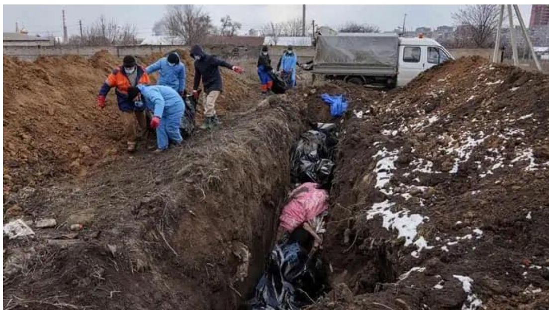
Ομαδικοί τάφοι όπου θάβονται πολίτες στη Μαριούπολη. Αυτοί οι άνθρωποι σκοτώθηκαν σε ρωσικούς βομβαρδισμούς και αεροπορικές επιδρομές