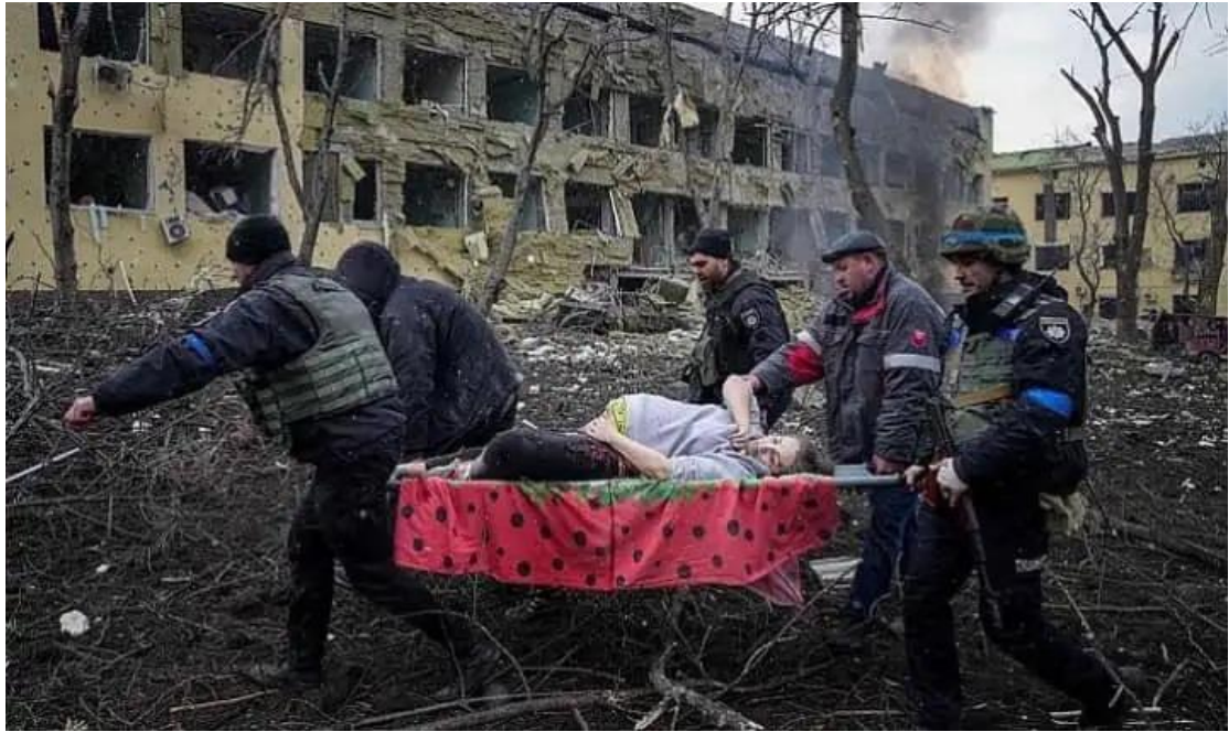
Ο απόηχος ενός ρωσικού βομβαρδισμού σε νοσοκομείο παιδων και μαιευτήριο στη Μαριούπολη (9 Μαρτίου 2022)