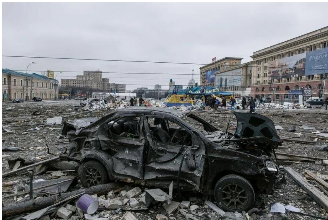
Ο απόηχος ενός ρωσικού βομβαρδισμού στην κεντρική πλατεία του Χάρκοβο (1 Μαρτίου 2022)