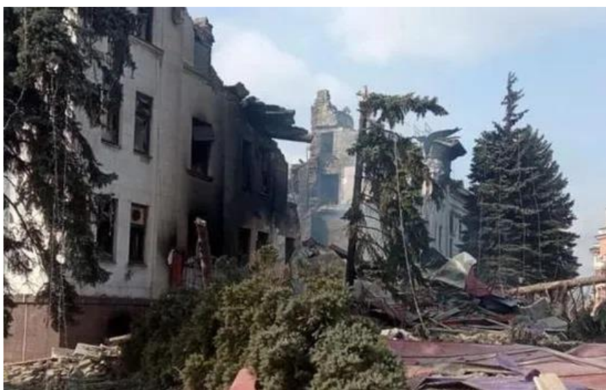
Οι συνέπειες του βομβαρδισμού στο Δραματικό Θέατρο της Μαριούπολης. Το κτίριο χρησίμευσε ως καταφύγιο για γυναίκες και παιδιά (16 Μαρτίου 2022)