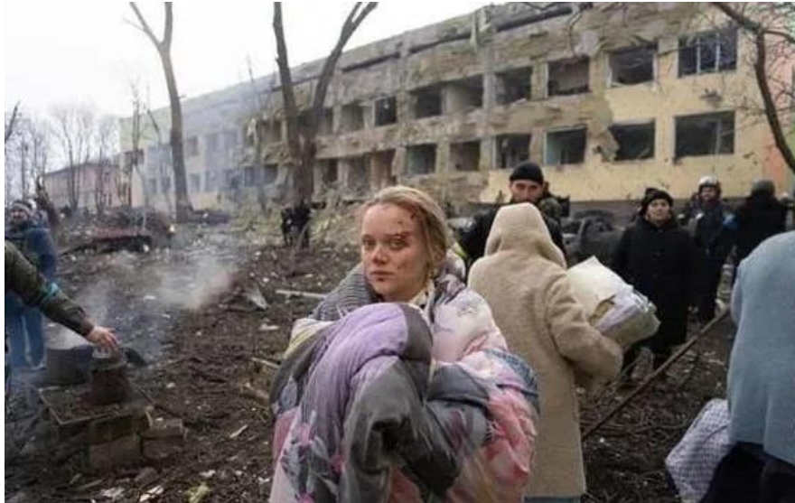
Ο απόηχος ενός ρωσικού βομβαρδισμού σε νοσοκομείο παιδων και μαιευτήριο στη Μαριούπολη (9 Μαρτίου 2022)